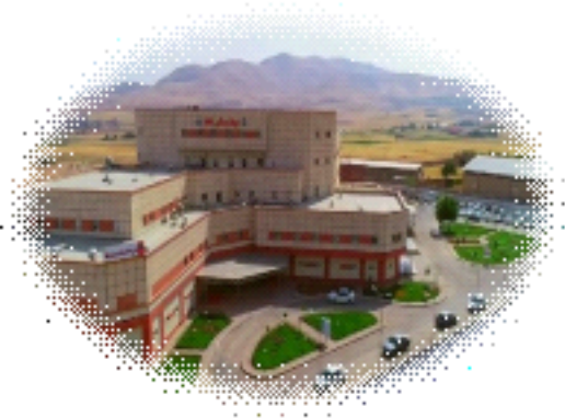
واحد آموزش بیمارستان شفا سقر